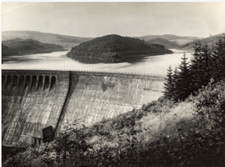
Erich Sander: Aggertalsperre bei Gummersbach, 1933 Courtesy: Die Photo- graphische Sammlung/ SK Stiftung Kultur – August Sander Archiv, Köln