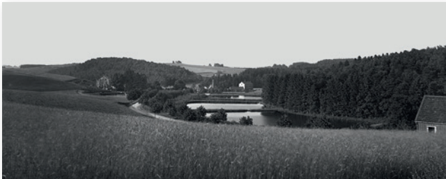
Niedergaul in Wipperfürth, 1894 – 1900