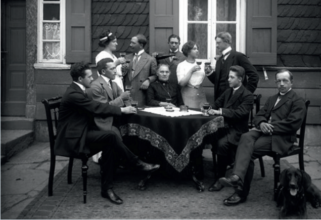
Vordersseite: Emil Hardt, Pavillon Sanderhöhe in Wipperfürth, um 1910; Rückseite: Emil Hardt, Verlobungsfeier Wurth und Röttenscheid, 1911 © Hansstadt Wipperfürth und Heimat- und Geschichtsverein Wipperfürth